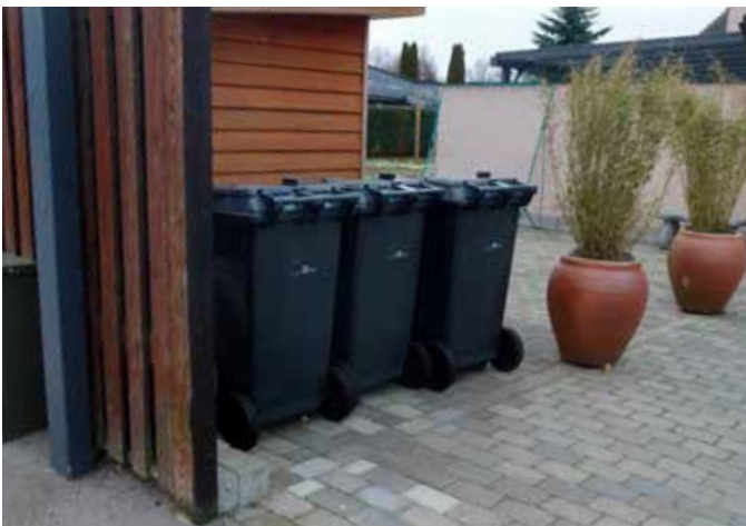
Også her har borgeren anlagt en standplads og kørevej med fast underlag