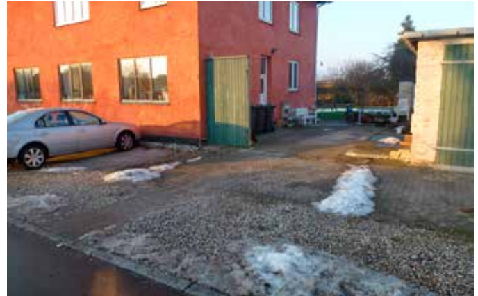
Her har borgeren lagt fliser igennem de løse sten for at lave en god adgangsvej for skraldemanden