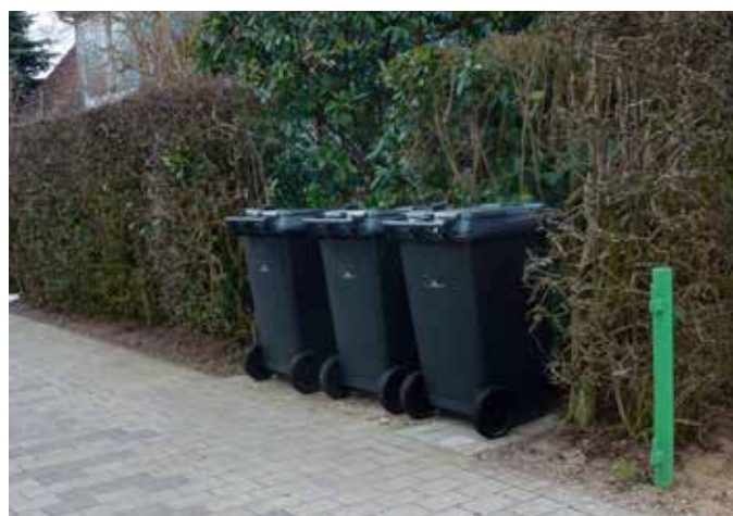
Her er beholderne nærmest "bygget ind" i hækken