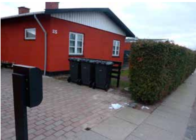
Her har borgeren valgt at sætte beholderne op ad et hegn