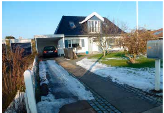
Praktisk placering på borgers vej til bilen