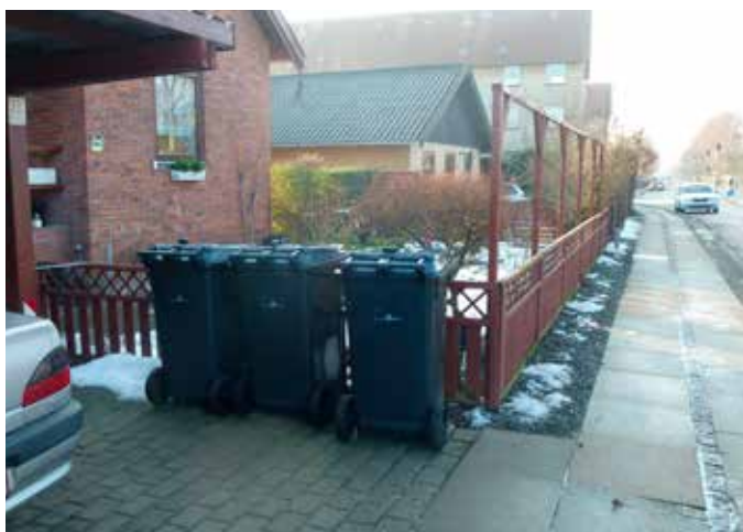
Borgeren har valgt at sætte beholderne ved fortovet