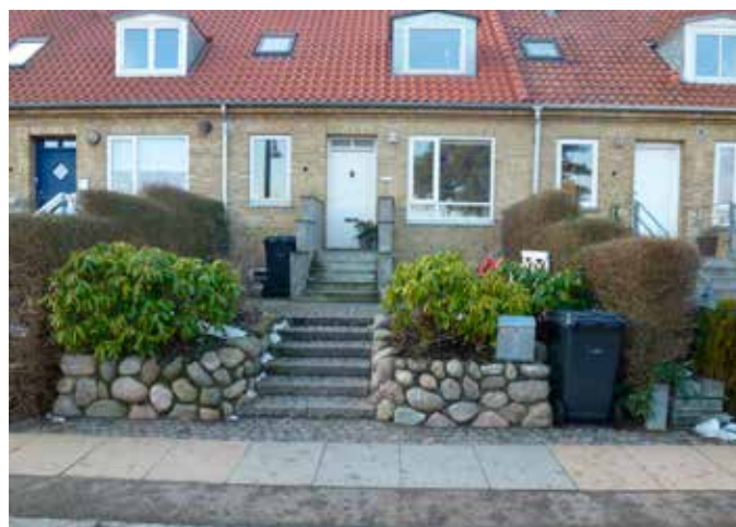
Her er der problemer pga. af trappen. Beboerne har valgt en enkelt standplads ved fortovet, hvor de stiller beholderen ned, når den skal tømmes