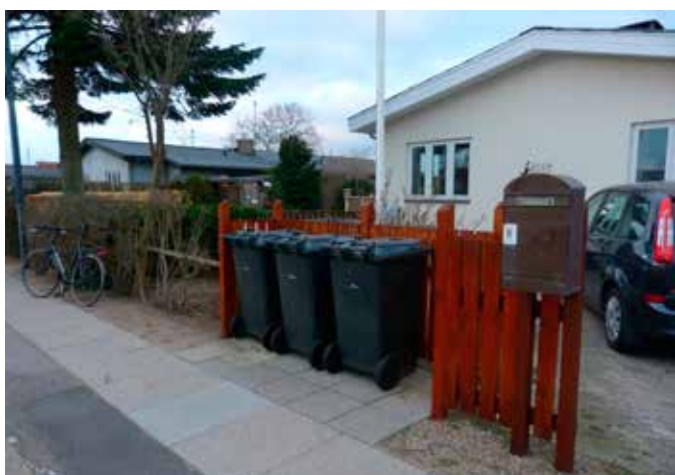
Borgeren har lavet en lille plads med hegn omkring