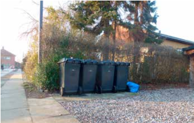
Her er der lavet en plads med fliser i perlegruset