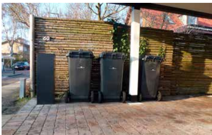
Beholderne kan placeres i carporten – her er de sat bag postkassen