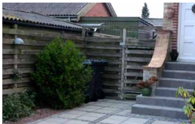
Beholderne kan placeres diskret i et hjørne, hvor de skærmes af en busk